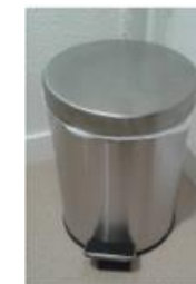
Sac poubelle non apparent

ATTENTION à la couleur de l'eau au fond de la cuvette ET au-dessous de la lunette