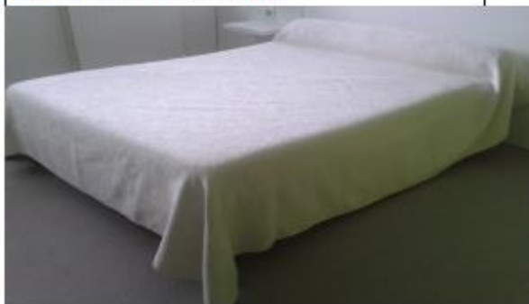
Dessus de lit NON bordé