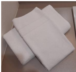
1 drap de bain + 1 serviette de bain côté douche