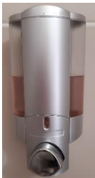
Distributeur gel douche rempli au 1/3