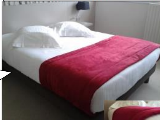
Lit bordé et coins au carré

Critères de réussite d'un lit avec couette bien fait : aucun pli, bien bordé, couette au ras de la tête de lit, taies d'oreillers ouverture coté fenêtre, oreillers en losange